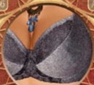
19 Art. 391