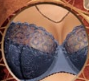
13 Art. 392