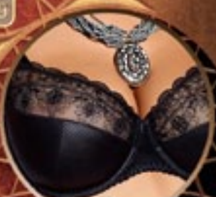
24 Art. 395