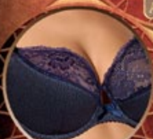
21 Art. 387