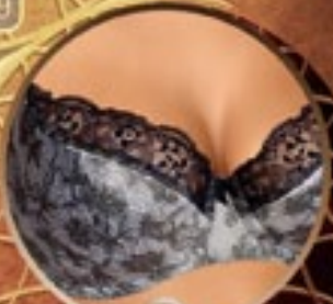
8 Art. 388