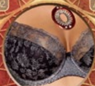
18 Art. 390