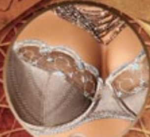
1 Art. 396