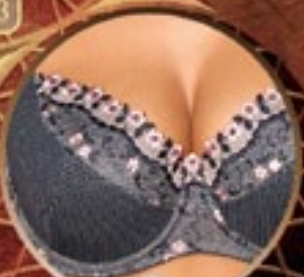
17 Art. 398