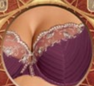
22 Art. 218