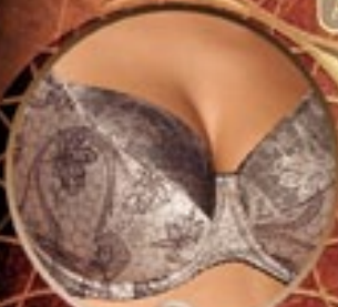
5 Art. 399