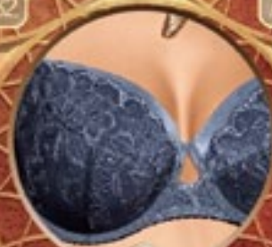
12 Art. 393