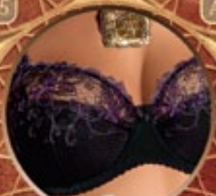
15 Art. 394