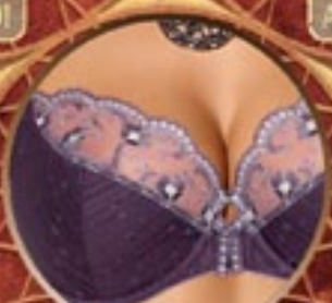
23 Art. 218