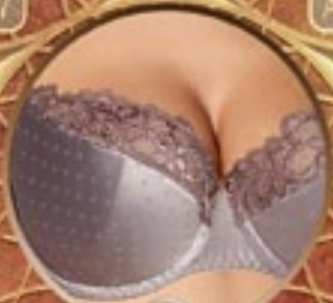
7 Art. 382