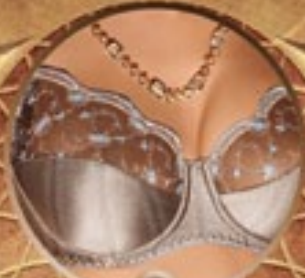
2 Art. 397