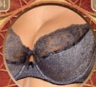
20 Art. 389