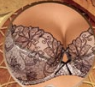
3 Art. 369