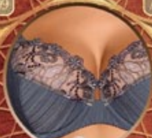
10 Art. 384