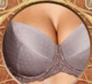
6 Art. 383