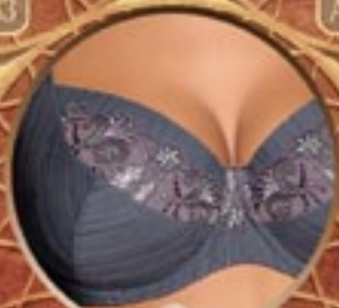
11 Art. 385