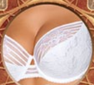
14 Art. 386